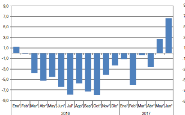
Gráfico 1. ISAC. Variación porcentual respecto a igual mes del año anterior