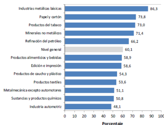
Gráfico 1. Utilización de la capacidad instalada en la industria. Julio de 2018

Los sectores que presentan un menor uso de la capacidad instalada son: Alimentos y bebidas (por la baja de la molienda de cereales y oleaginosas), productos del tabaco (caída en la producción), industria textil (contracción en los niveles de elaboración de tejidos y de hilados de algodón), papel y cartón, edición e impresión, refinación del petróleo (ante paradas de planta), sustancias y productos químicos, productos de caucho y plástico, productos minerales no metálicos (disminución de la producción de cemento y vidrio) y la metalmecánica excepto automotores.